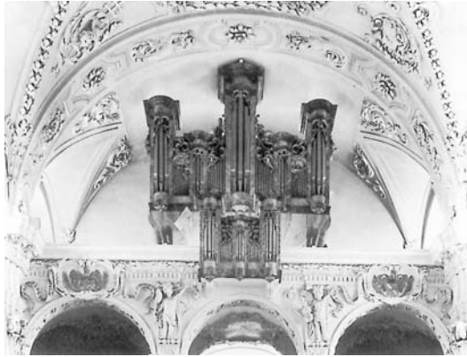
Orgelempore in der Jesuitenkirche, der Platz für die Aufführung der Kirchenmusik. Die Orgel von Franz Josef OTTER aus Aedermannsdorf wurde erst 1793 erbaut.

Das Jesuitenkollegium ist 1646 gegründet worden. Zwischen 1676 und 1730 wurde der heute noch bestehende Baukomplex mit Kirche, Schul- und Gymnasiumsgebäude errichtet. Theateraufführungen hatten im Schuljahr der Jesuiten ihren festen Platz und waren seit Beginn mit Gesang, Musik und Tanz verbunden. Ebenso bedeutend war die Kirchenmusik an Sonn- und Festtagen, wo mit wenigen Ausnahmen nicht nur der Morgengottesdienst, sondern auch die