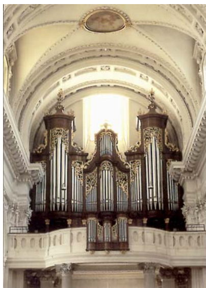
St. Ursenkirche (heute: Kathedrale), Orgelempore im jetzigen Zustand. In der ersten Hälfte des 20. Jahrhunderts wurde sie an den Seiten erweitert.

Das im 8. Jahrhundert gegründete Chorherrenstift St. Urs war die älteste Stätte der Musikausübung. Die Institution der Choraulen (Chorknaben für den Messgesang) scheint bis auf die